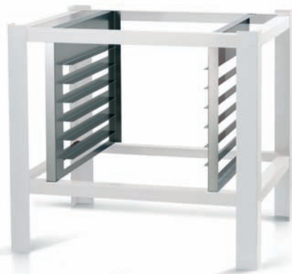
RACK PORTA TEGLIE BAKING - PANS RACK