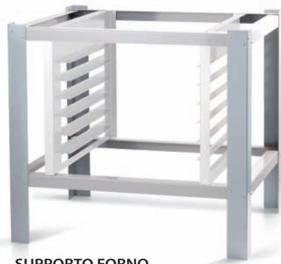
SUPPORTO FORNO OVEN SUPPORT